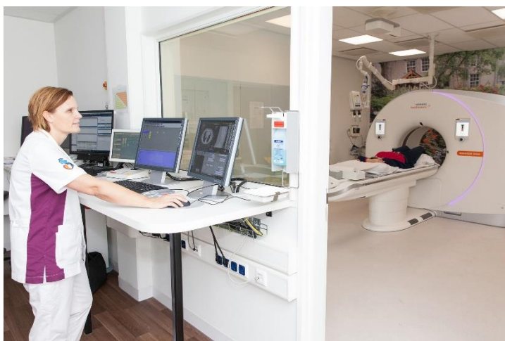
Afbeelding 2: De ruimte naast de CT-kamer waar de laborant staat.

De laborant schuift u door de opening van het apparaat tot de plaats die moet worden onderzocht (zie afb. 1). Deze opening is een ring en geen afgesloten tunnel. Het is belangrijk dat u tijdens het onderzoek goed stil ligt. Terwijl u door de ring schuift worden er foto's gemaakt. Deze foto's worden verwerkt door de computer. Tijdens het onderzoek is de laborant in de ruimte naast de CT-kamer (zie afbeelding 2). De laborant kan u zien door een raam en met u praten via een intercom.