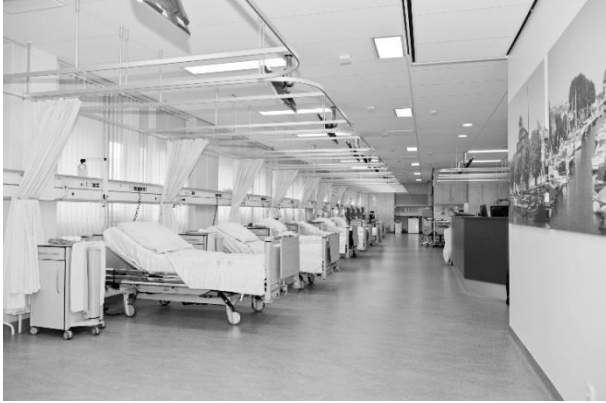
Afbeelding 1: Dagbehandeling G1.

De verpleegkundige vraagt u om een operatiejasje en -sokken aan te doen. Deze liggen voor u klaar op het nachtkastje. De verpleegkundige meet uw bloeddruk en uw temperatuur en het opnamegesprek vindt plaats.