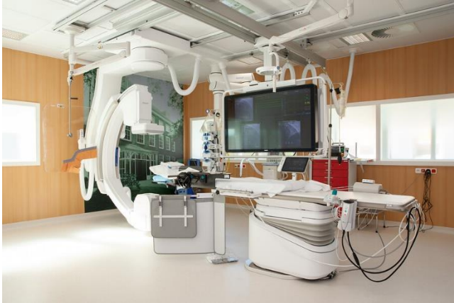
Afbeelding 2: De behandelkamer

De implantatie gebeurt op de behandelkamer die naast de Dagbehandeling G1 zit.