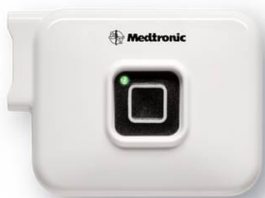
Afbeelding 4: De uitwendige stimulator is ongeveer 3 bij 4 cm.

De tijdelijke geleidingsdraad wordt vervolgens via een kabeltje op de uitwendige stimulator aangesloten (zie afbeelding 4). U draagt de uitwendige stimulator aan een riempje om uw lichaam.